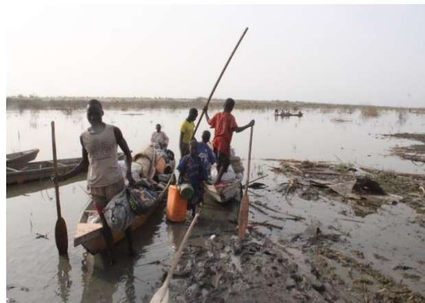
Réfugiés Nigériens de Hakoui Tchouloum

Le Tchad accueille 474,000 réfugiés et demandeurs d'asile et plus de -100,000 retournés Tchadiens de la RCA.