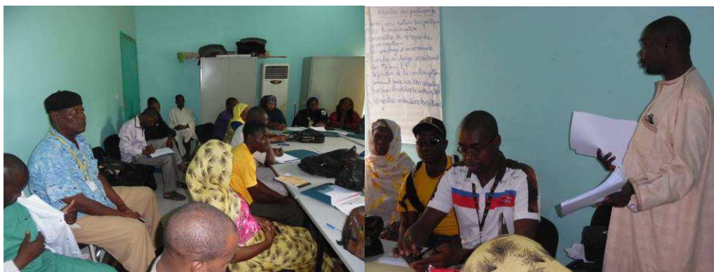
Formation sur la technologie contraceptive. Photo, IRC, juillet 2015.