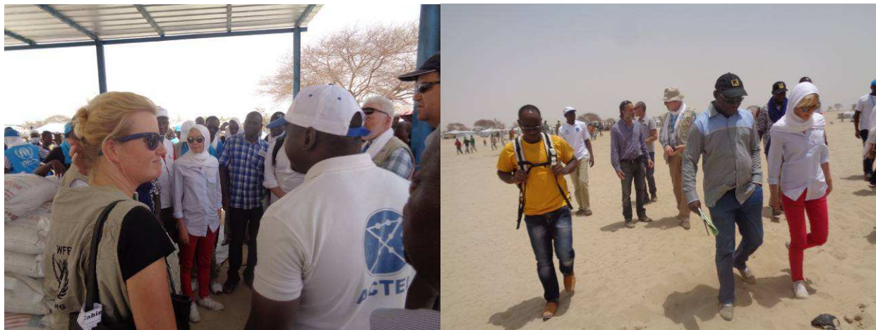
Visite d'ECHO au camp de Kabelawa. juillet 2015.