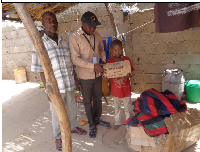
Don de kit à l'enfant non accompagné.