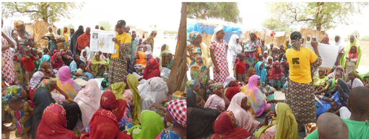
Sensibilisation en Santé Reproductive à Chétimari. Photo, IRC, juillet 2015.