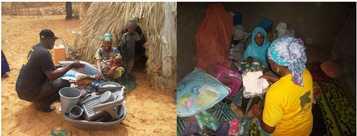
Distribution de kits bébé à deux femmes réfugiées. Photo, IRC, juillet 2015.