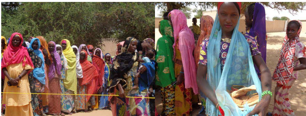
Sourires inestimables de réfugiés Nigeriens ayant fui Damasak et bénéficient d'une assistance alimentaire à Diffa. Photo, IRC, juillet 2015.