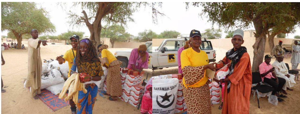
Assistance alimentaire aux déplacés à Chetimari et Gagamari. Photo, IRC, juillet 2015.