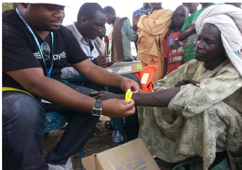
Pose de bracelet aux réfugiés de Kaiga/Kindjiria en attendant leur transfert vers Dar Es Salam @HCR/juin