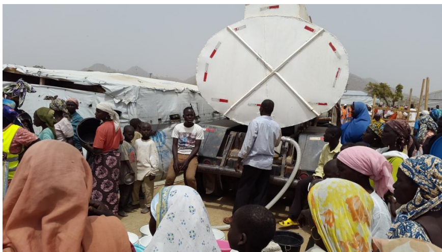
Approvisionnement du camp de Minawao en eau au par une équipe de MSF.