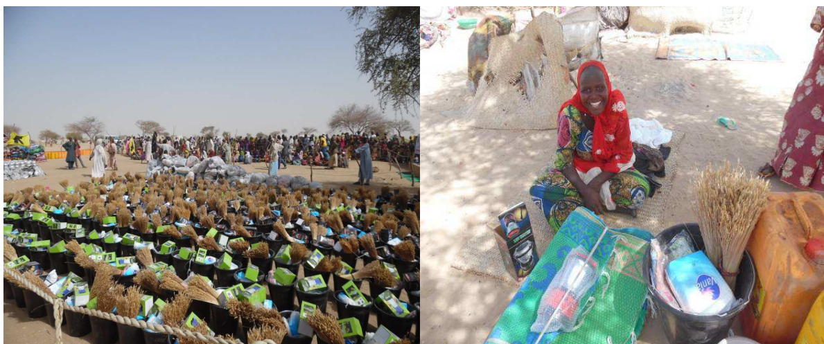
Distribution de kit NFI à N'Guel Wanzam. Photo, IRC.