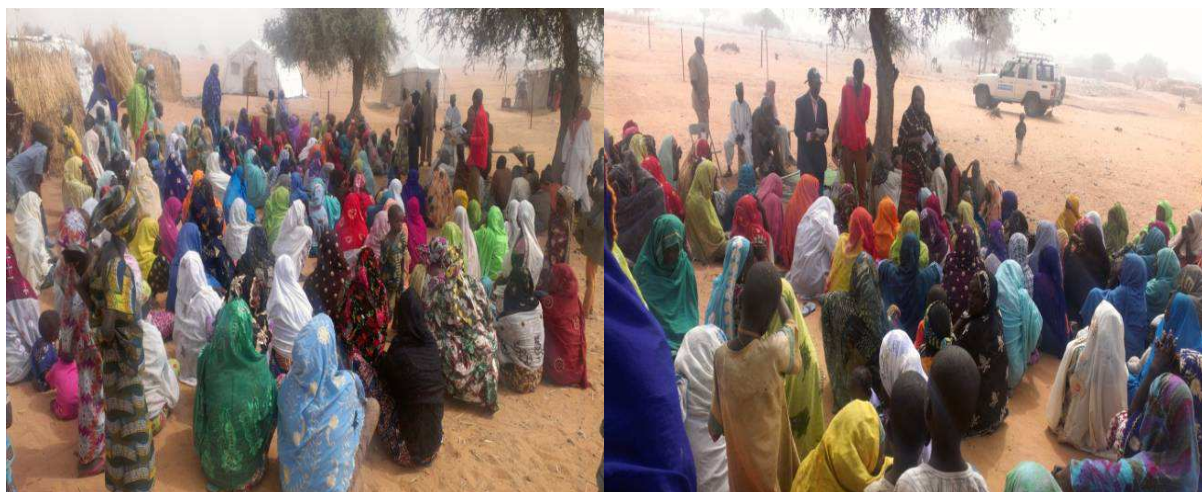
Séance de sensibilisation en santé de la mère et néonatale.