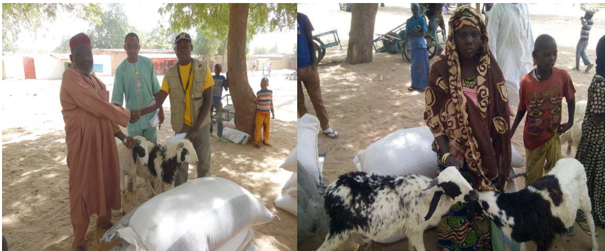
Remise de kit d'activité génératrice de revenu à Diffa.

de Diffa. Parallèlement à cette activité, huit (8) réfugiées vulnérables, chefs de ménage dans le quartier Afnori de Diffa ont reçu chacun, un kit de démarrage d'activité génératrice de revenu dont notamment l'embouche et pour certains la Boucherie. Cette assistance économique a été réalisée avec le financement du bailleur BPRM. En amont, chacun de ces bénéficiaires a reçu un transfert monétaire inconditionnel pour satisfaire leur besoin alimentaire.