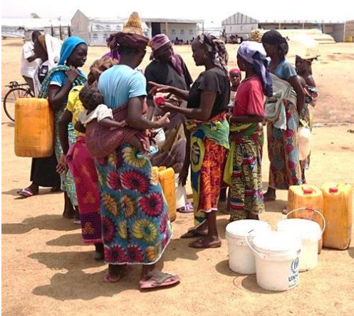
Réfugiés à un point d'eau