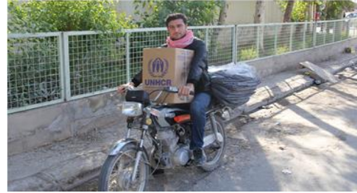
توزيع مساعدات الاستعداد للشتاء والمواد غير الغذائية في العراق

ويستمرّ الشركاء في خطة «3» RP في توفير المساعدات الشتوية، والمواد غير الغذائية للاجئين أثناء موسم الشتاء العاصِب. فقد جرى، من خلال برنامج المساعدات بالقسائم النقدية، توزيع القسائم النقدية الشتوية على 13,911 فرداً، مع دعم 3,000 أسرة أخرى بالبطاقات النقدية في محافظة «قهرمان مرعش» Kahramanmaraş، ومحافظة «إصلاحية» Islahiye و«نزيب» Nizip، في غازي عنتاب.