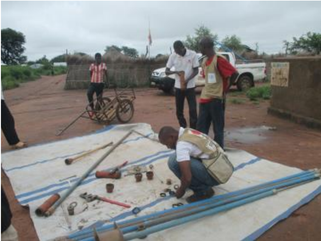
Réhabilitation forage du site C