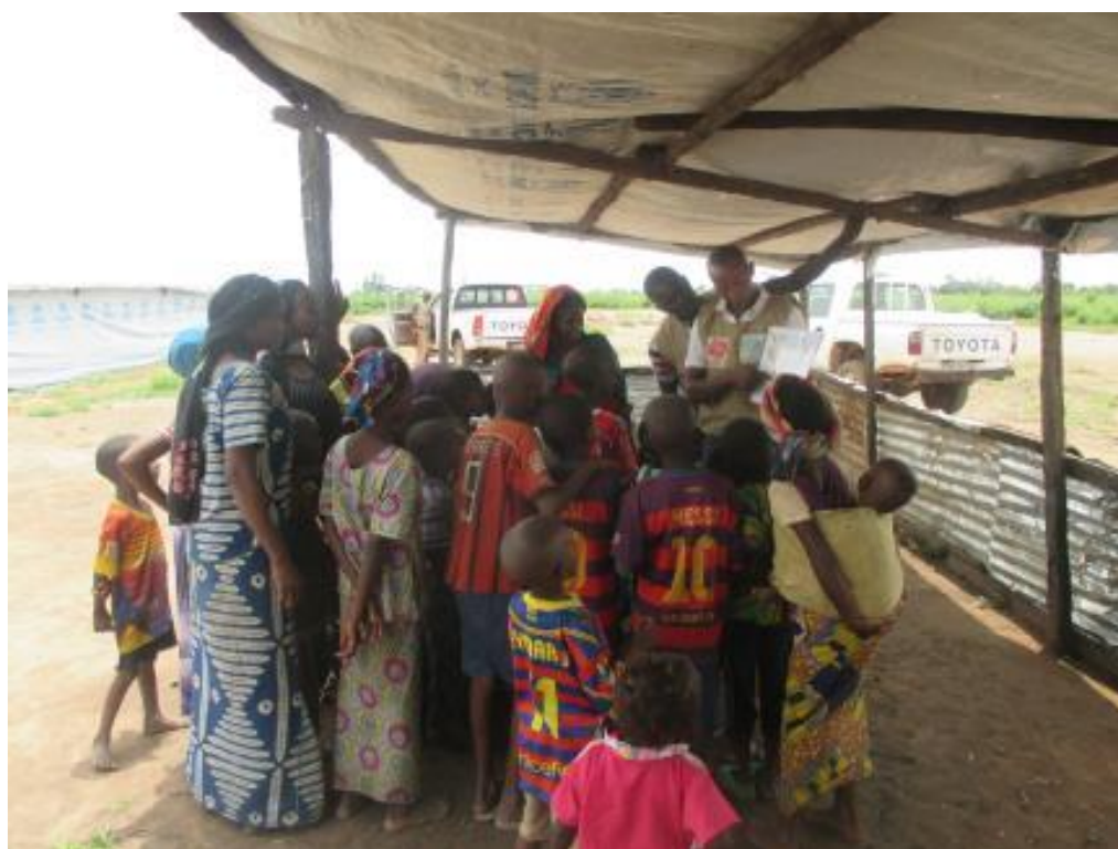
Séance de sensibilisation des enfants du site bâche aux bonnes pratiques d'hygiène