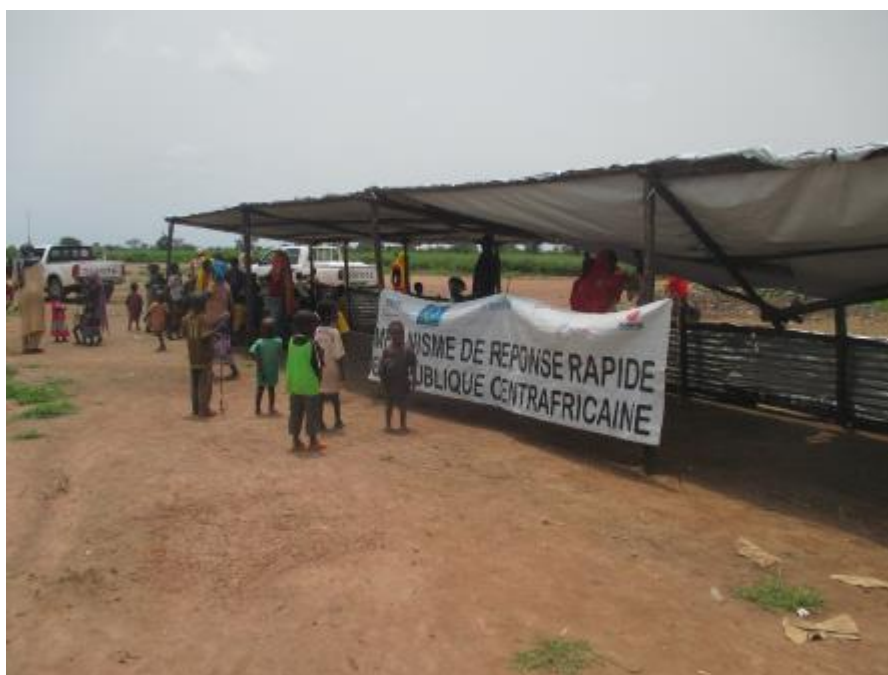
Préparation de la distribution de savons, site bâche