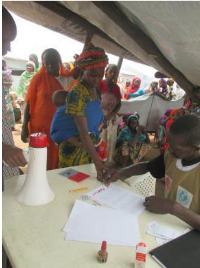
Distribution de savons, site bâche