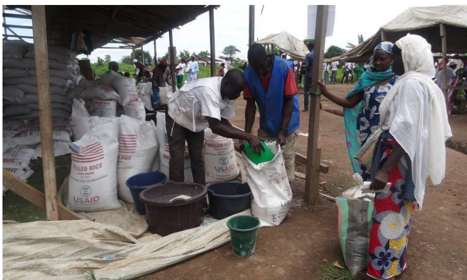
Distribution générale des vivres à Mandjou.

Un total de 274,090 réfugiés centrafricains concernés :