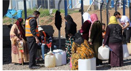
توزيع كمية إضافية من الكيروسين للعائلات المستضفة في مخيم داراشكران للاجئين، إربيل، إقليم كردستان العراق.