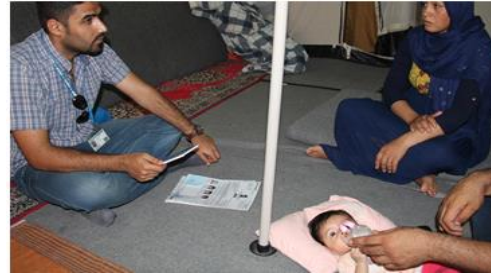
الرقابة على الحماية في مخيم أرباط للاجئين، تموز 2016 - محافظة السليمانية.

وتشمل الدوافع المشتركة لعمالة الأطفال التي حُددت عبر مختلف البلدان عوامل اقتصادية واجتماعية. فعلى الجانب الاقتصادي، تتضمن العوامل ذات التأثير الشديد: الفقر المُدقع للاجئين، ومحدودية دخول اللاجئين إلى سوق العمل الرسمي، ومحدودية فرص الحصول على تعليم جيد. وعلى الجانب الاجتماعي، كان من بين أبرز الدوافع: التغيرات الحاصلة في بنية الأسرة، وزيادة نسبة النساء اللاتي يتكفلن بإعالة أسرهنّ، والتغير الحاصل في أدوار الأطفال النازحين، وتغير اتجاهات المجتمع نحو أدوار الجنسين فيما يتعلق بعمالة الأطفال. إن تقييم المسائل يرسم حدود الفهم المشترك للأطر القانونية الدولية والوطنية المتعلقة بعمالة الأطفال، ويصف أسباب عمالة الأطفال وعواقبها الوخيمة؛ استجابةً للأزمة السورية. وتشمل التوصيات المتعلقة بالممارسة تعزيز تنفيذ السياسات الوطنية والأطر القانونية، والخدمات المخصصة لمكافحة عمالة الأطفال، وتيسير فرصة حصول اللاجئين على تلك الخدمات، والعمل مع المجتمعات المحلية منعاً لأسوأ أشكال عمالة الأطفال، وبناء قدرات الهيئات العاملة في مجالات حماية الطفل والتعليم وسُبل كسب العيش، والحصول على المساعدات المالية لتطوير برامج مكافحة عمالة الأطفال، وتعزيز جمع جيد للبيانات حول عمالة الأطفال إلى جمع وتحليل مستمرين للبيانات؛ ومن ذلك الزيارات المنزلية.