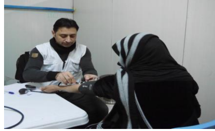
فحص المؤشرات الحيوية في حجرة الفحص، مركز الصحة الأساسية بمخيم كوبلان، العراق

في مصر، عمل شركاء الصحة بالتعاون مع وزارة الصحة والسكان لتحديد احتياجات وحدات الصحة العامة المتواجدة في المناطق المأهولة بكثافة من اللاجئين السوريين، وإنهاء شراء 10 حاضنات لحديثي الولادة لتدعيم قدرة مستشفيات كبريتين بمحافظة الجيزة.