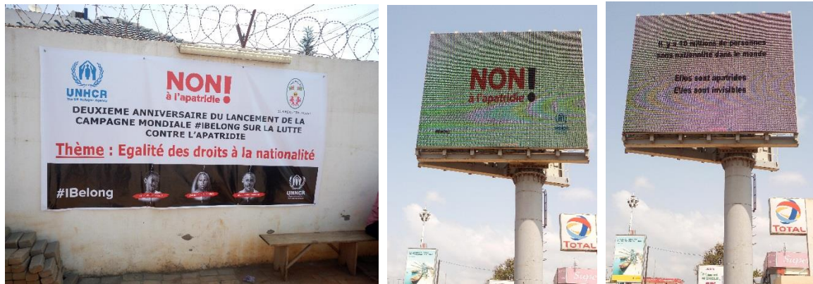
Banderoles et affiches au bureau du HCR Togo et sur les panneaux géants de la place publique pour la sensibilisation sur l'apatridie