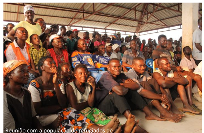
Reunião com a população de refugiados de