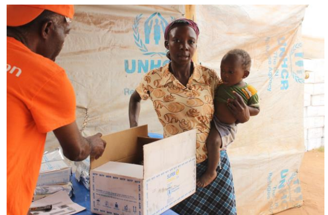
Mãe e seu filho durante a distribuição de Super Cereal.