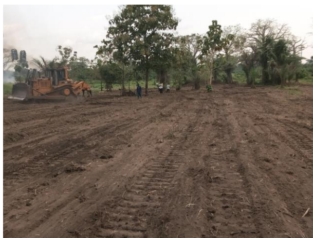
Site d'élevage à Bolou-Kpondavé en plein aménagement pour la construction des poulaillers, bergeries et porcheries