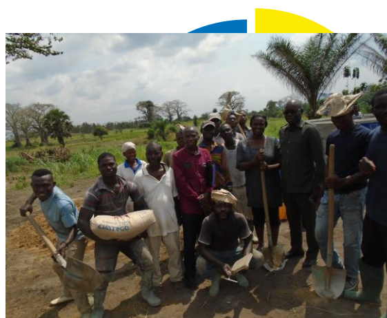
Le Représentant a.i. du HCR au Togo à la rencontre des réfugiés et autochtones bénéficiaires du projet agropastoral en plein travaux de construction des infrastructures d'élevage à Bolou-Kpondavé