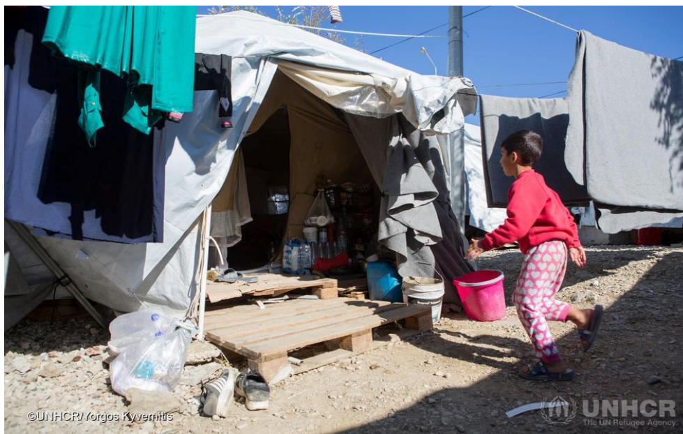
Πρόσφυγες και αιτούντες άσυλο ζουν σε δύσκολες συνθήκες υπερσυνωπισμού στη Λέσβο