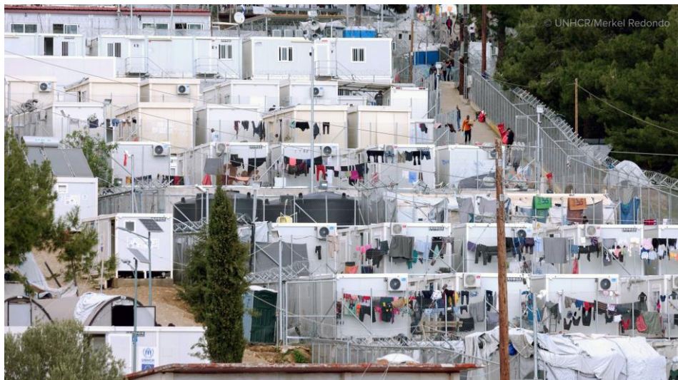
Οι αιτούντες άσυλο ζουν σε συνθήκες υπερπυκνότητας στο κέντρο υποδοχής στο Βαθύ της Σάμου.