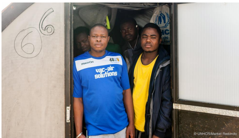
Κέντρο υποδοχής στο Βαθύ Σάμου.

6 Γραφεία στα νησιά σε Λέσβο, Χίο, Σάμο, Λέρο, Κω και Ρόδο