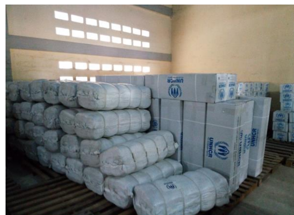
La Ministre de l'Action Sociale, de la Promotion de la Femme et de l'Alphabétisation, Mme Tchabinandi Kolani Yentcharé exprimant les remerciements du Gouvernement au HCR Togo (photo à gauche) et les articles humanitaires entreposés dans un magasin (photo à droite)