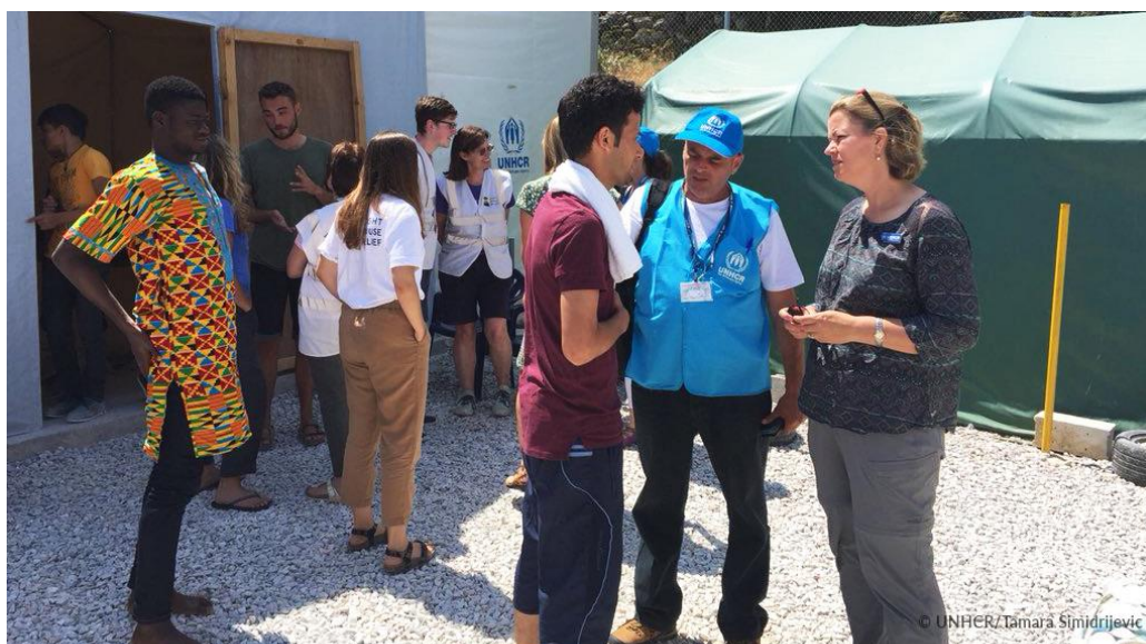
Η Αναπληρώτρια Υπάτη Αρμοστής του ΟΗΕ για τους Πρόσφυγες, Kelly T. Clements, συνομιλεί με νεοαφιχθέντες στον προσωρινό χώρο διέλευσης της Υ.Α. στη βόρεια Λέσβο.