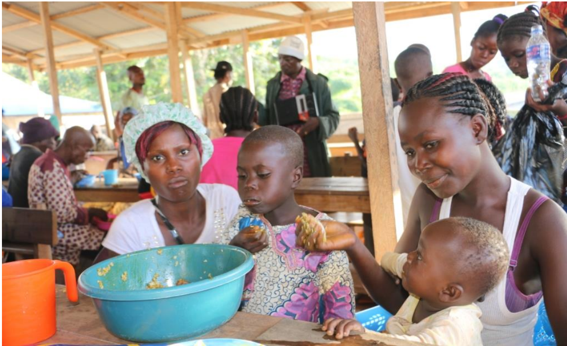
Avant de regagner leurs villages respectifs, les rapatriés prennent un repas chaud au Centre de Transit de Toulepleu