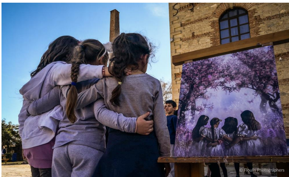
Η Ύπατη Αρμοστεία του Ο.Η.Ε. για τους Πρόσφυγες στήριξε το σχολικό φεστιβάλ που έφερε κοντά Έλληνες και πρόσφυγες μαθητές.

10 Γραφεία σε Θεσσαλονίκη, Λέσβο, Αττική, Χίο, Σάμο, Κω, Έβρο, Ιωάννινα, Λέρο και Ρόδο