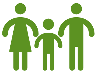
Personnes dans le besoin