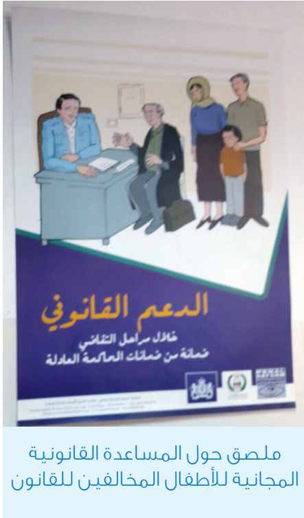
ملصق حول المساعدة القانونية المجانية للأطفال المخالفين للقانون

معه. كما يمكن تقديم أنواع أخرى مناسبة من المساعدة مثل مساعدة العامل الاجتماعي. لكن ينبغي أن يكون «مقدم المساعدة على قدر كاف من المعرفة والفهم بخصوص شتى الجوانب القانونية لعملية قضاء الأحداث، وأن يكون مدرّجاً للعمل مع الأطفال المخالفين للقانون» (الفقرة ٤٩ من التعليق العام رقم ١٠ - اتفاقية حقوق الطفل).