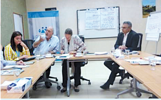
فريق البحث التابع لليونيسف/ المجلس الوطني لشؤون الأسرة