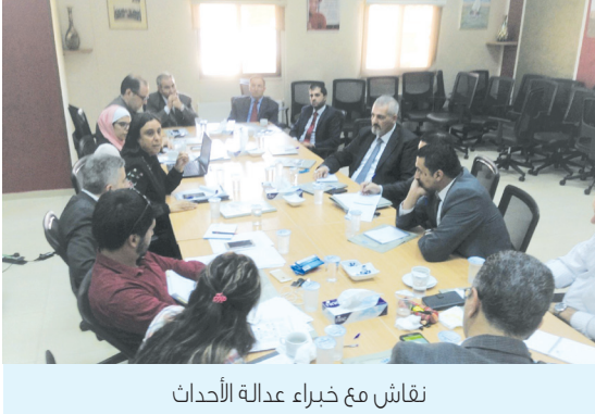
نقاش مع خبراء عدالة الأحداث

لشؤون الأسرة بناءً على إستبيانات شبه منظمة تم توزيعها عليهم مسبقاً.