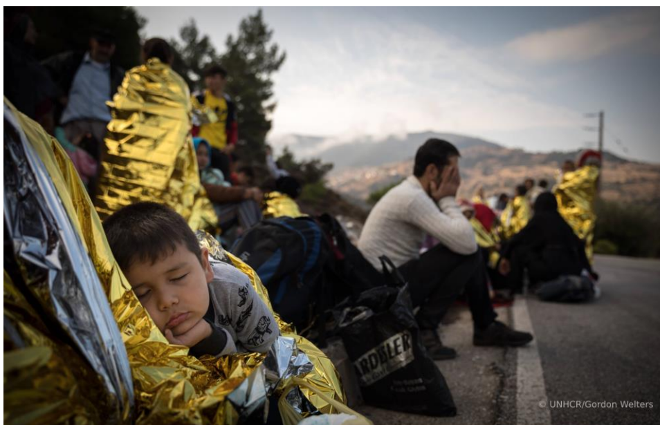
Νεοαφθόντες Αφγανοί πρόσφυγες περιμένουν να μεταφερθούν στο κέντρο διέλευσης της Υ.Α. και στο κέντρο υποδοχής στη Μόρια το οποίο διαχειρίζονται οι ελληνικές αρχές.

10 Γραφεία σε Θεσσαλονίκη, Λέσβο, Αττική, Χίο, Σάμο, Κω, Έβρο, Ιωάννινα, Λέρο και Ρόδο