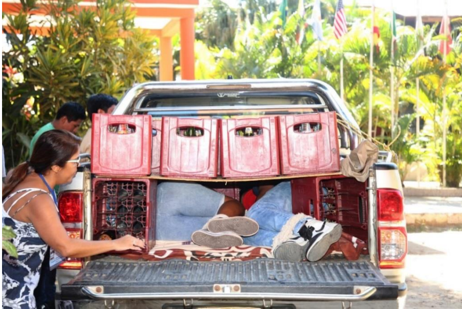
Ejercicio simulado de tráfico de migrantes en amazonia peruana en frontera con Brasil. Entrenamiento a policías y fiscales de la región.

De acuerdo con las cifras actualizadas de Migración Colombia 1 , al 31 de mayo de este año había 1.764.883 venezolanos en Colombia, de los cuales 1.001.472 en situación irregular y 763.411 en situación regular.