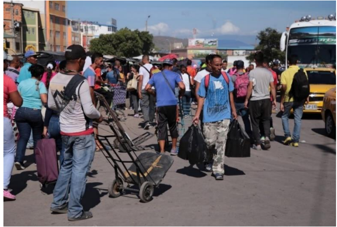
Población venezolana cruzando por La Parada, Norte de Santander

De acuerdo con el artículo 188a del Código Penal colombiano, se entiende por trata de personas la captación, traslado, acogida o recibimiento de una persona, dentro del territorio nacional o hacia el exterior, con fines de explotación. Según el artículo 3 de la Ley 985 de 2005, la explotación se entiende como la obtención de algún provecho económico o cualquier otro beneficio para sí o para otra persona, mediante la explotación de la prostitución ajena u otras formas de explotación sexual, los trabajos o servicios forzados, la esclavitud o las prácticas análogas a la esclavitud, la servidumbre, la explotación de la mendicidad ajena, el matrimonio servil, la extracción de órganos u otras formas de explotación.