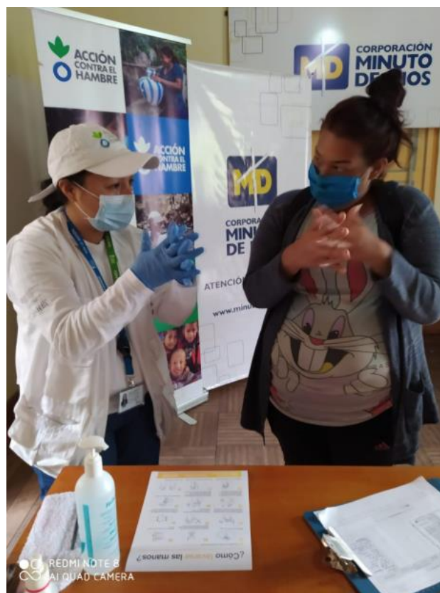
Jornadas de entrega de kits de higiene y de educación a población refugiada y migrante proveniente de Venezuela con vocación de permanencia en prácticas de higiene y lavado de manos para la prevención COVID 19 en el municipio de Pasto por parte de Acción Contra el Hambre en articulación con la Corporación Minuto de Dios.