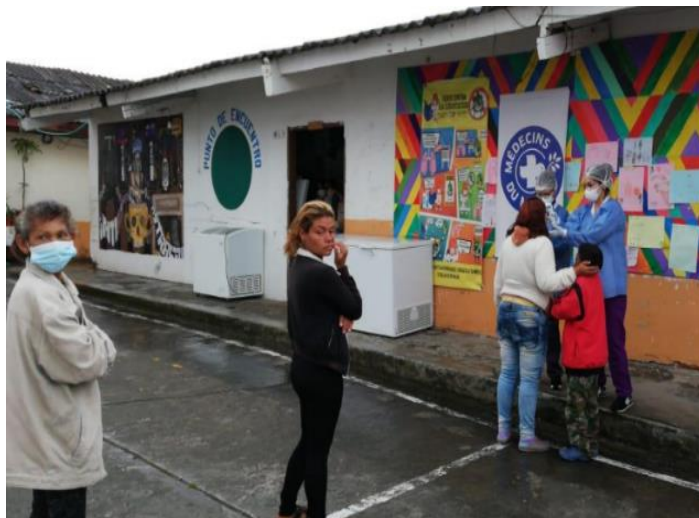
Jornadas de atención en salud por parte de Médicos del Mundo a población refugiada y migrante proveniente de Venezuela en el albergue Nubes Verdes de la ciudad de Ipiales.