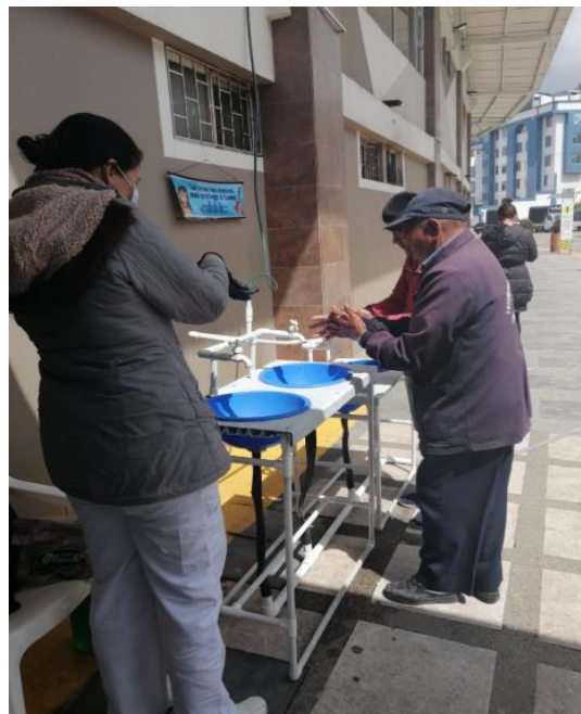
Población del municipio de Ipiales, utilizando los lavamanos portátiles instalados en la Terminal de Transporte por parte de UNICEF, como medida de prevención COVID-19.