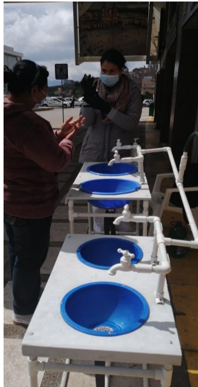
Ilustración 4. Punto lavado de manos Terminal de transporte Terrestre de Ipiales

El primer punto para el lavado de manos fue instalado en la terminal terrestre del municipio de Ipiales, conformado por 4 puntos para el lavado de manos: 2 niños - niñas y 2 para adultos.