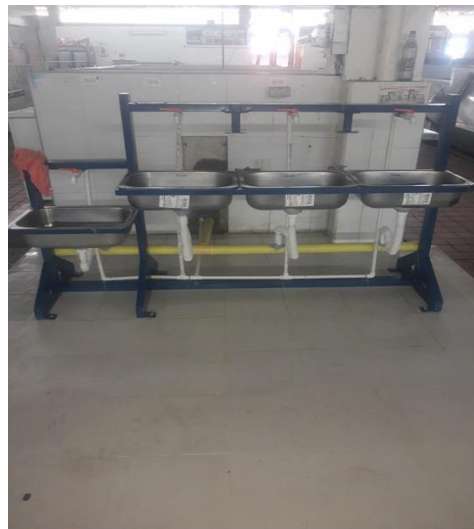
Ilustración 6. Punto de Lavado de manos Central de abastos de Cúcuta

Otros 3 sistemas fueron instalados en la central de abastos de Cúcuta, cada uno conformado por 4 puntos para el lavado de manos, tres (3) puntos para adultos y uno (1) de niños.