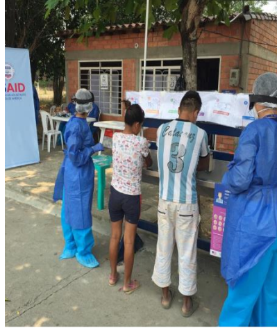
Ilustración 7. Punto de Lavado de manos El Escobal