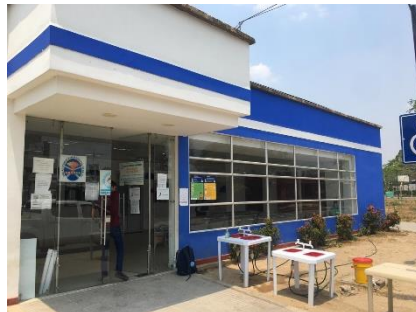
Ilustración 3. Punto lavado Centro de Salud de la comuna 13 – Municipio de Arauca