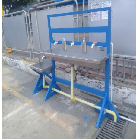
Ilustración 5. Punto lavado de manos Terminal de Transporte Terrestre de Cúcuta

En la terminal de transporte terrestre de Cúcuta, fueron instalados dos (2) sistemas, conformados cada uno por 4 puntos para el lavado de manos: 1 niños - niñas y 3 para adultos.