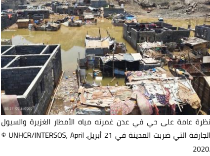
نظرة عامة على حي في عدن غمرته مياه الأمطار الغزيرة والسيول الحارقة التي ضربت المدينة في 21 أبريل، April، UNHCR/INTERSOS، © 2020.

استمرت الأمطار الغزيرة في التسبب في حدوث سيول جارفة مدمرة وإلحاق أضرار جسيمة بالممتلكات والبنية التحتية في المحافظات الجنوبية. حدد تقييم أولي تضرر حوالي 5,000 أسرة نازحة داخلياً، نصفها في محافظتي عدن ولحج في حوالي 79 موقع من مواقع استضافة النازحين داخلياً. الاحتياجات العاجلة التي تم تحديدها شملت المأوى والغذاء والأدوات المنزلية الأساسية. وقد قامت المفوضية بتزويد 940 أسرة في لحج بأغطية بلاستيكية بديلة لإصلاح أماكن الإيواء المتضررة، في حين ستحصل حوالي 65 أسرة على الأدوات المنزلية الأساسية مثل الفرش وأدوات المطبخ والمصابيح الشمسية. وفي محافظة مأرب، قامت المفوضية، من خلال شريكها جمعية الهلال الأحمر اليمني، بتقديم المساعدات إلى 110 أسرة من الأسر النازحة داخلياً المتضررة من السيول من خلال وحدات الإيواء الطارئة و 120 أسرة من خلال الأدوات المنزلية الأساسية. أيضاً، حصلت 95 أسرة نازحة حديثاً على هذه المستلزمات. وخلال الفترة المشمولة بالتقرير، تم إجراء تقييم شمل حوالي 140 أسرة نازحة تسكن مؤقتاً في الفنادق، وسيتم تزويدها بالمساعدات النقدية ولوازم الطوارئ وخدمات الحماية، وفقاً لاحتياجاتها.