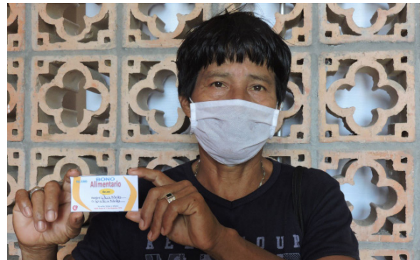
Un líder indígena de los Embera Dóvida muestra un bono de alimentos entregado por ACNUR.

bons de alimentos a familias indígenas, desplazadas y venezolanas.