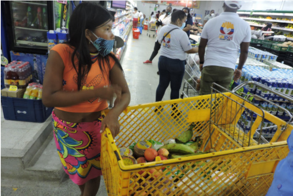
La comunidad indígena Embera Dóvida de Quibdó es sobreviviente del conflicto armado y actualmente enfrentan inseguridad alimentaria debido al COVID-19 y las restricciones. ACNUR está proporcionando bonos de alimentos para que puedan satisfacer sus necesidades básicas en tiendas locales.