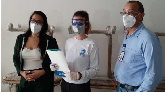
ACNUR donó Equipos de Protección Personal a los hospitales de La Guajira.

En Riohacha, ACNUR donó Equipos de Protección Personal a los hospitales de San Juan y Riohacha.