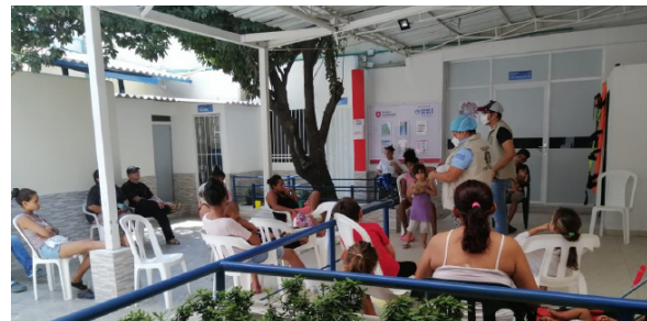
Los adultos que se alojan en el refugio temporal del Centro de Asistencia para Refugiados y Migrantes (CARM) en Maicao participan en una capacitación virtual sobre aptitudes generales y adaptación al cambio con el SENA.

El 26 de mayo se celebró una Conferencia Virtual de Donantes Internacionales para refugiados y migrantes de Venezuela convocada por la Unión Europea y España con el apoyo de Canadá, Noruega, ACNUR y OIM, en la que se recaudaron 2.790 millones de dólares, incluidos préstamos y donaciones (653 millones de dólares en donaciones). Los países donantes estuvieron representados a nivel ministerial y los Presidentes de Colombia, Ecuador y España intervinieron durante la sesión de alto nivel de la conferencia. El Gobierno de Canadá anunció su compromiso de acoger y organizar la próxima reunión de seguimiento de esta conferencia.