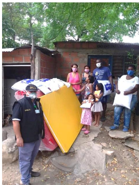
Entrega de colchonetas y almohadas a familias en el sector de El Escobal, en Norte de Santander.

Durante el mes de mayo, más de 21.000 beneficiarios recibieron una o más asistencias a través de 20 socios e implementadores del RMRP, en 34 municipios de 17 departamentos, tanto en zonas de frontera como de tránsito y asentamiento de refugiados y migrantes. El subgrupo ha enfocado su respuesta en el acompañamiento y monitoreo de la ocupación, expansión y diversificación de alojamientos temporales y transitorios. En cuanto a la distribución de artículos de hogar, se continuó realizando en pequeña escala en cumplimiento con las medidas preventivas ante COVID-19. El transporte humanitario siguió suspendido. Se lideró la construcción de herramientas para el seguimiento y respuesta a situaciones de desalojos forzados.