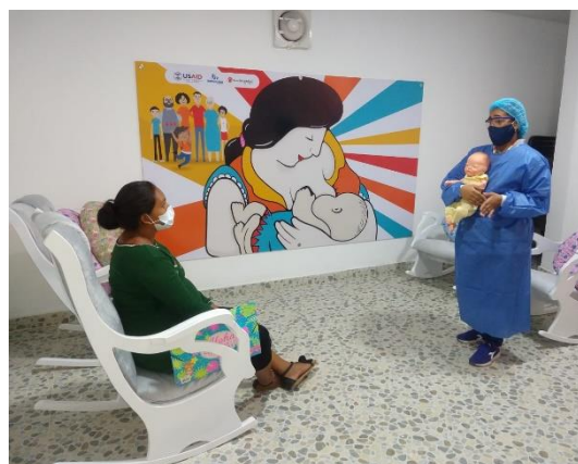
En el espacio "Esquina de la Lactancia", de la Unidad de Salud Sexual y Reproductiva, se brinda atención en salud para madres venezolanas y colombianas gestantes y lactantes en Maicao, La Guajira.

Durante el mes de mayo , más de 60.400 beneficiarios recibieron una o más asistencias a través de 36 socios e implementadores del RMRP, en 51 municipios de 24 departamentos, tanto de frontera como de tránsito y asentamiento de población proveniente de Venezuela. Para el mes de mayo se resalta el trabajo de los socios en la adecuación de los servicios de salud para mantener la respuesta humanitaria a través de estrategias de citas programadas, atención domiciliaria y telefónica. Las prioridades del sector correspondieron a promover el acceso a elementos de protección personal e higiene respiratoria para la población refugiada y migrante en tránsito y con vocación de retorno y facilitar el acceso a actividades de información y educación para la prevención del riesgo y la implementación de medidas de distanciamiento físico y reforzar las acciones de vigilancia y diagnóstico. De igual manera, se contribuyó con el apoyo al aislamiento de población refugiada y migrante sin red de apoyo en el país, y se brindó acceso a servicios de salud prioritarios, incluida la atención de enfermedades crónicas, enfermedades transmisibles y no transmisibles.