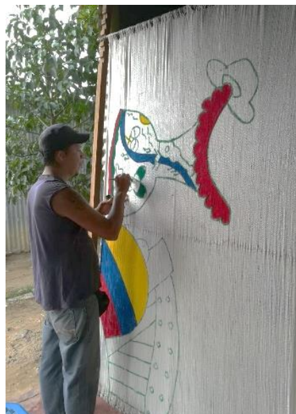
Actividad de integración a través de la construcción de chinchorro en el municipio de Arauca donde participaron refugiados, migrantes y comunidad de acogida cumpliendo con todas las normas de bioseguridad.

Durante el mes de mayo, más de 10.200 beneficiarios recibieron una o más asistencias a través de 18 socios e implementadores del RMRP, en 17 municipios de 12 departamentos, tanto fronterizos como de permanencia de refugiados y migrantes. Para el mes de mayo se destaca la realización de encuestas de monitoreo de situación y de afectación de unidades productivas, tanto en La Guajira en el marco de la Mesa de integración Socioeconómica, como en Norte de Santander, como insumos para la preparación de propuestas de movilización de fondos. Otra prioridad del sector -particularmente en Norte de Santander- fue la articulación de las acciones de aliados con el diseño del Plan de Desarrollo.