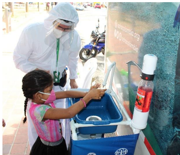
Por medio de su Unidad Móvil de Primera Respuesta en Salud, ADRA beneficia a los refugiados y migrantes en Bucaramanga, Santander, con servicios y orientación sobre el lavado de manos.

Las principales acciones del sector comprendieron la entrega de kits y elementos clave de saneamiento e higiene para más de 46.300 refugiados y migrantes, considerando las necesidades diferenciales de mujeres, niñas, niños, adolescentes, madres gestantes, entre otros perfiles. Igualmente, más de 35.800 personas recibieron servicios de agua y saneamiento a nivel comunitario e institucional. Así mismo, más de 31.900 personas -incluyendo población receptora- accedieron a instalaciones y capacitación sobre agua segura y saneamiento básico en sus comunidades. También se destaca el acceso diario a servicios de agua y saneamiento en puntos de prestación de servicios (centros de salud, albergues, comedores, escuelas, etc.) para más de 12.300 personas, entre ellas más de 3.400 niños, niñas y adolescentes que accedieron a dichos servicios en espacios de aprendizaje y espacios de desarrollo infantil. Así mismo, más de 11.300 personas -incluyendo población receptora- accedieron a agua segura y saneamiento básico en sus comunidades.