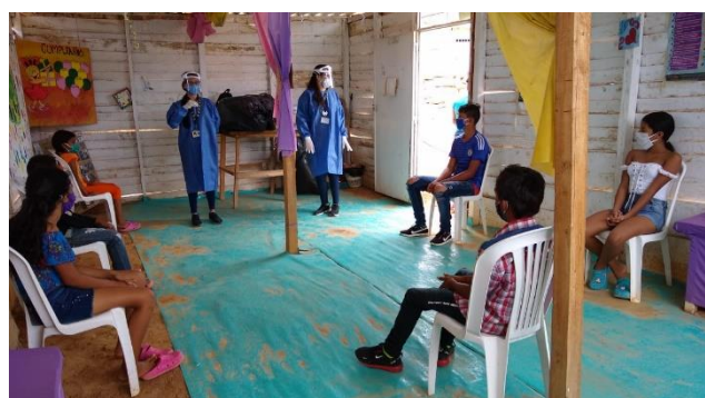
En Cúcuta, Norte de Santander, IRC implementa la “Estrategia de prevención de violencia en los hogares”, en donde las familias refugiadas y migrantes participan en actividades para descargar emociones y sobre cómo evitar la violencia intrafamiliar.

Durante el mes de mayo, más de 33.300 beneficiarios recibieron una o más asistencias en protección a través de 50 socios e implementadores del RMRP, en 76 municipios de 26 departamento de frontera, de tránsito y en otros donde se asienta la población proveniente de Venezuela. El sector de protección se continuó identificando, activando rutas y ofreciendo servicios de protección a través de respuestas adaptadas por las medidas de aislamiento: líneas de atención telefónica, medios virtuales, redes sociales y la apertura gradual de algunos servicios que ofrecen los Espacios de Apoyo, en línea con los lineamientos de la OPS/OMS en zonas de frontera.