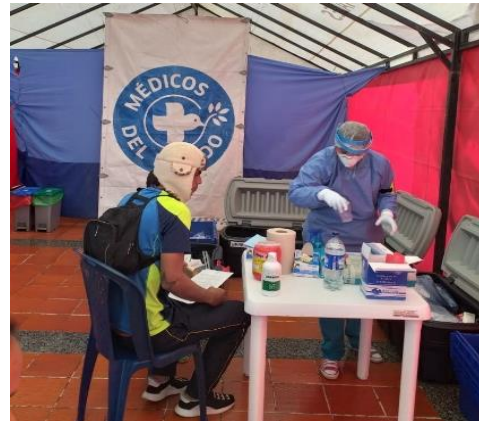
Servicios de consulta médica, psicología y anticoncepción a población refugiada y migrante proveniente de Venezuela en el municipio de Ipiales.