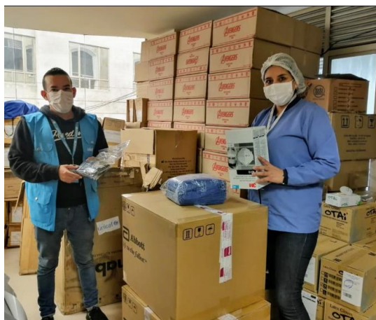
Entrega de elementos de protección personal, insumos de limpieza y desinfección para centros de salud de Ipiales.

En el municipio de Tumaco en articulación con la Personería Municipal, comienza la respuesta con transferencias monetarias en cash for rent para las personas en riesgo de desalojo.