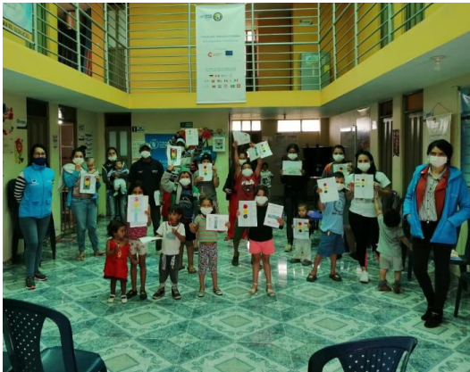
Actividad psicosocial para prevención COVID-19 en el albergue Los Chilcos, en el municipio de Ipiales.

Identificación y asistencia a población refugiada, migrante y población de acogida con riesgo de desalojo en los municipios de Tumaco, Ipiales y Pasto.