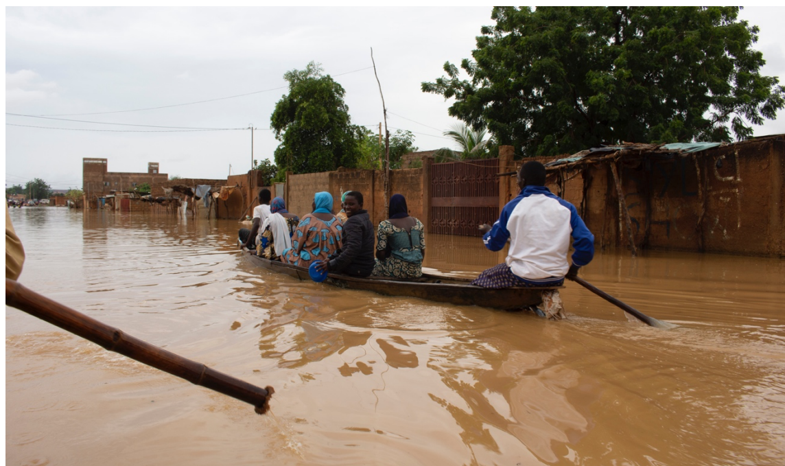
Niamey le 6 septembre 2020 : une digue protégeant plusieurs quartiers riverains du fleuve a cédé sous la pression des eaux.