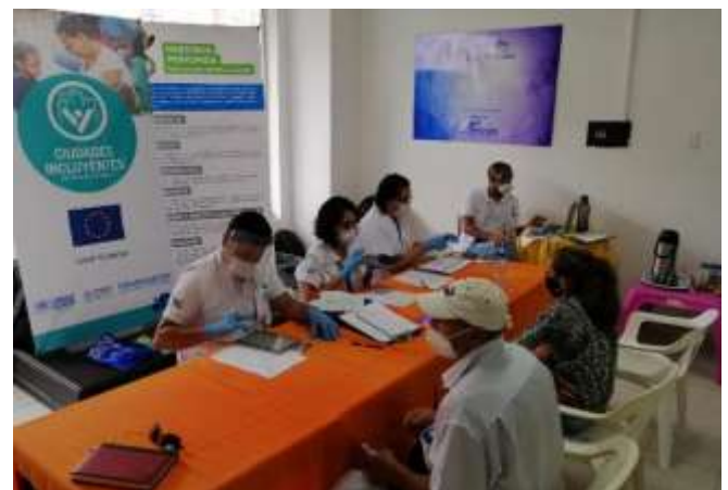
Entrega de tarjetas electrónicas en el marco de la estrategia de intervención basada en efectivo.

1.464 personas alcanzadas con entrega de efectivo multipropósito en Bucaramanga.