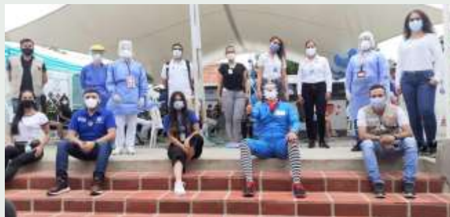
Foto Historia: “El Centro Margarita cumple dos años”

El Centro La Margarita, ubicado en el corregimiento de La Parada, cumplió dos años de servicio en septiembre. En el Centro se prestan servicios como orientación jurídica y psicosocial (CORPRODINCO), control prenatal, atención primaria en salud a menores y planificación familiar (IRC), atención médica y entrega de medicamentos (Cruz Roja Colombiana), atención en salud sexual y reproductiva y medicina general (Profamilia) y atención en salud mental y apoyo a personal sanitario (OPS/OMS); y de la administración del Centro se encargan ACNUR y Opción Legal.