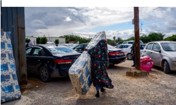
حملة المساعدات الشتوية في مخيم الفلاح 2 للنازحين.