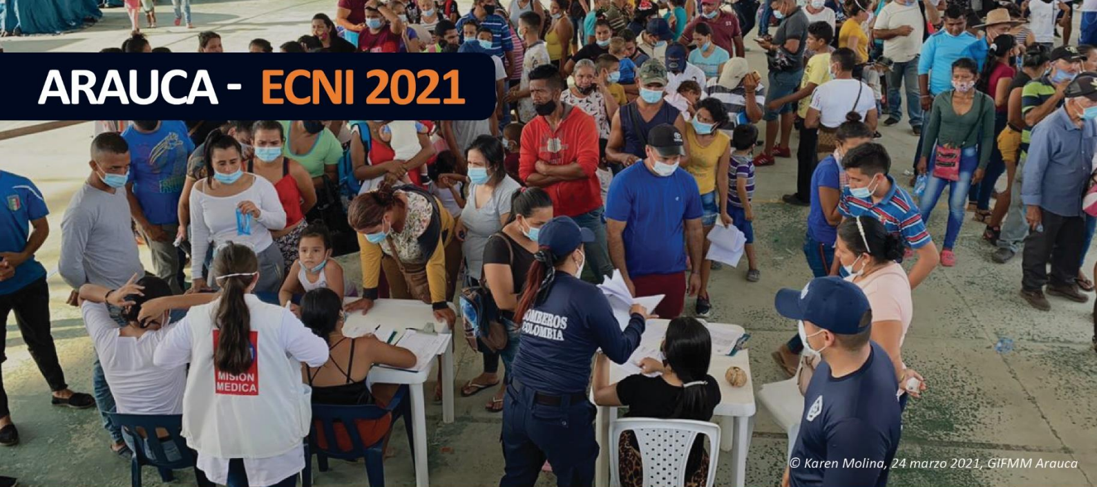
© Karen Molina, 24 marzo 2021, GIFMM Arauca