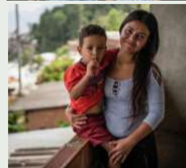
Refugiados y migrantes beneficiarios.