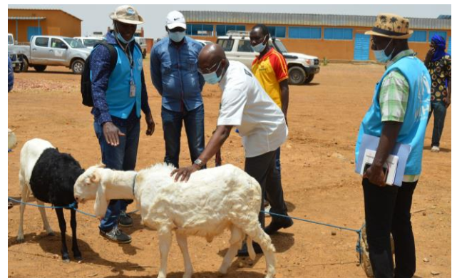
« Visite des expositions et réalisations par le Représentant du HCR à la JMR 2021 »