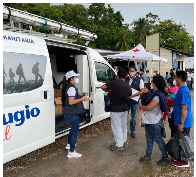
Asistencia brindada por los socios de ACNUR a personas en El Ceibo, Petén.

Además, en Tecún Umán, en la frontera con México, según información recibida por socios, se han observado grandes movimientos de personas haitianas, en su mayoría viajando con guía/coyote.