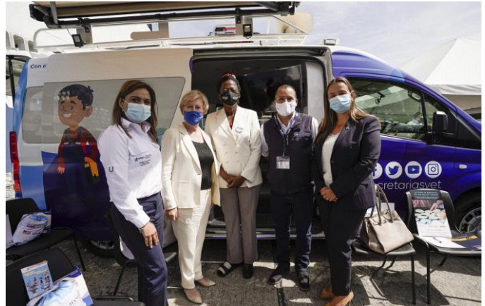
Lanzamiento de las UNIVETs.

Vicepresidente de Guatemala y la Secretaria Ejecutiva de la SVET. Las seis unidades móviles apoyarán los mecanismos de respuesta a la violencia sexual y de género en diferentes departamentos de Guatemala y mejorarán la provisión de información y derivación de casos a los servicios adecuados. Asimismo, el proyecto tiene un componente de prevención, ya que tiene como objetivo involucrar a los actores locales y líderes comunitarios para ayudar con la implementación del programa.