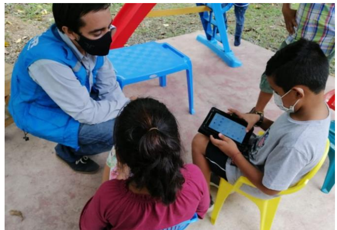
Distribución de tabletas digitales a niñas y niños refugiados en Izabal para garantizar su acceso a educación virtual.