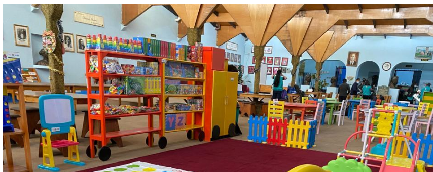
Inauguración de la biblioteca municipal recién equipada para niñas y niños en Quetzaltenango.