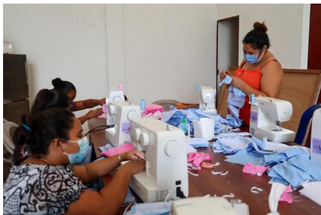
Mujeres participantes en el curso de costura en San Benito, Petén.