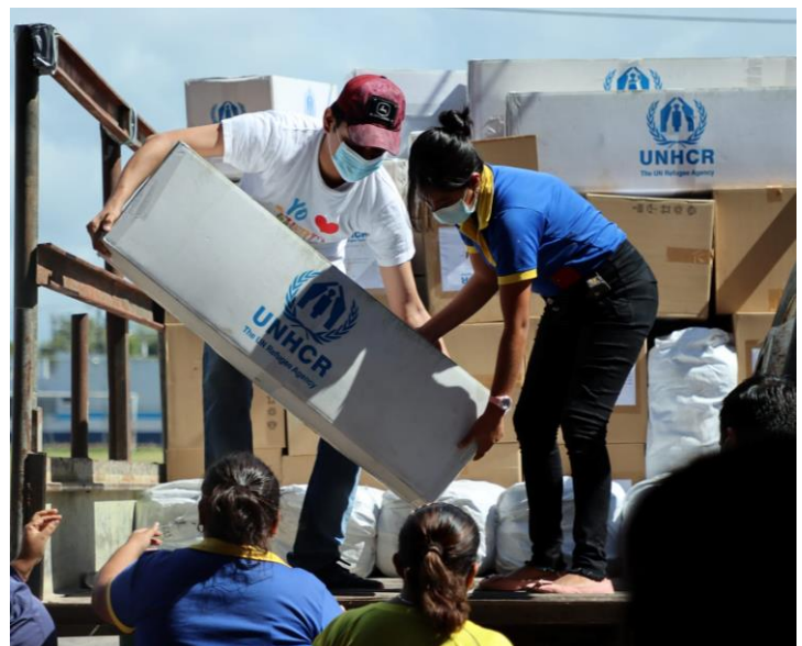
Distribución de artículos de primera necesidad por parte de ACNUR y personal de la Municipalidad de Puerto Barrios a las personas afectadas por las inundaciones en Izabal.