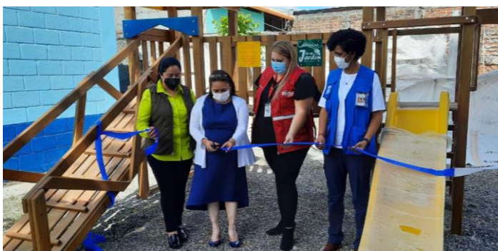
Inauguración de la escuela recientemente renovada y equipada en la aldea Las Majadas, Jutiapa.