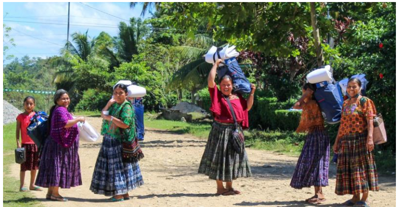
Comadronas en Sayaxché, Petén, portando maletines con equipo médico donado por ACNUR.