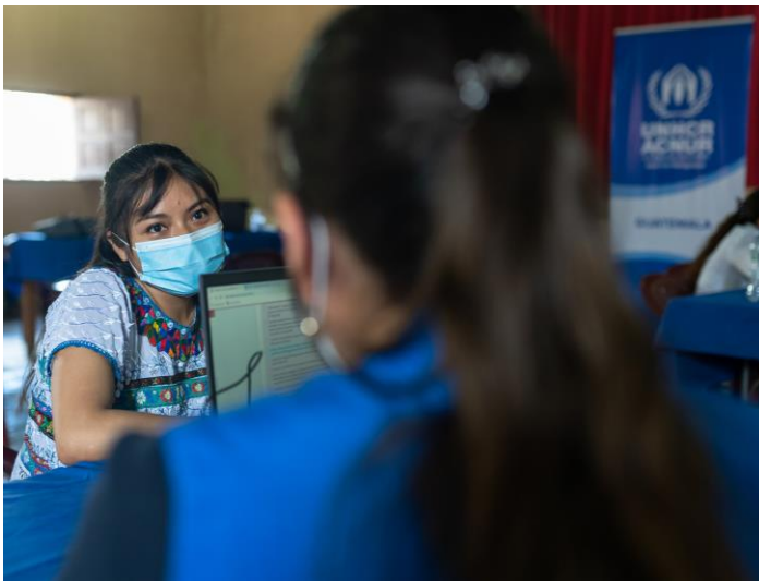
ACNUR en coordinación con organizaciones socias lleva a cabo actividades de registro en comunidades vulnerables de acogida para proporcionar asistencia