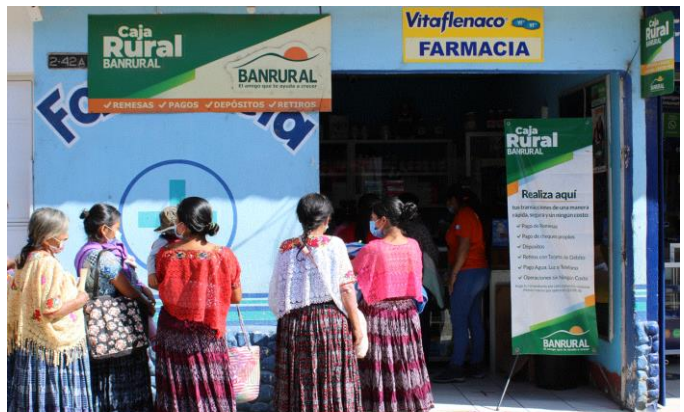
Mujeres indígenas guatemaltecas en riesgo de desplazamiento retiran su asistencia en efectivo en San Cristobal Verapaz, Alta Verapaz.