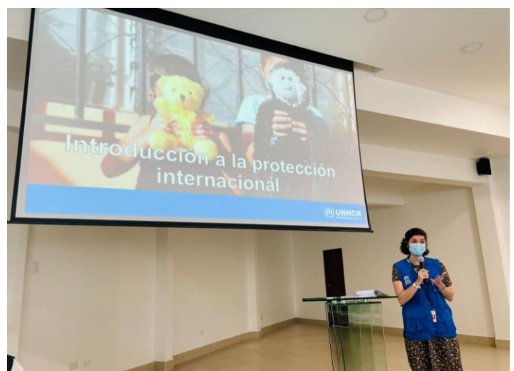
Capacitación en protección de personas refugiadas a 47 integrantes de la Red Departamental de Violencia, Explotación y Trata de Personas en Izabal.

Al mismo tiempo, las expulsiones de personas guatemaltecas y hondureñas en su mayoría bajo el Título 42, desde los Estados Unidos a México y desde allá a Guatemala, continúan. Basado en el monitoreo de las organizaciones socias de ACNUR así como en las estadísticas de las instituciones estatales, ACNUR estima que desde el principio de agosto de 2021, más de 30,000 personas han sido expulsadas a Guatemala, entre las cuales se identificaron al menos a 541 personas con necesidades de protección. Según el Instituto Guatemalteco de Migración, solo a través de la frontera de El Ceibo han sido expulsadas 18,195 personas, en su mayoría hondureñas.