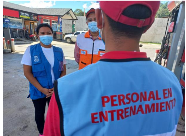
Guatemalteco en riesgo de desplazamiento inició su pasantía en una gasolinera en San Cristobal Verapaz, Alta Verapaz.