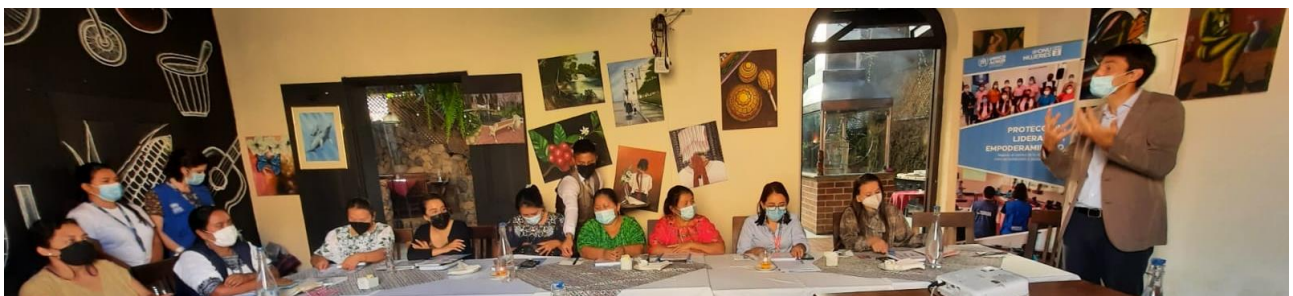
Intercambio con ONU Mujeres y la Red Departamental para la Protección de la Mujer en Alta Verapaz para dar seguimiento a la implementación del proyecto conjunto que tiene como objetivo fortalecer los esfuerzos de las comunidades e instituciones locales para prevenir y responder a la violencia de género.