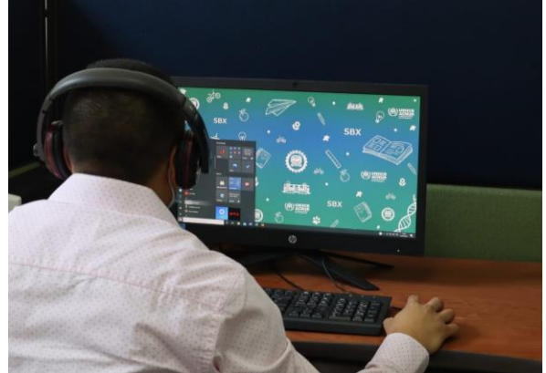
Uso del laboratorio de computación recién establecido en Quetzaltenango.