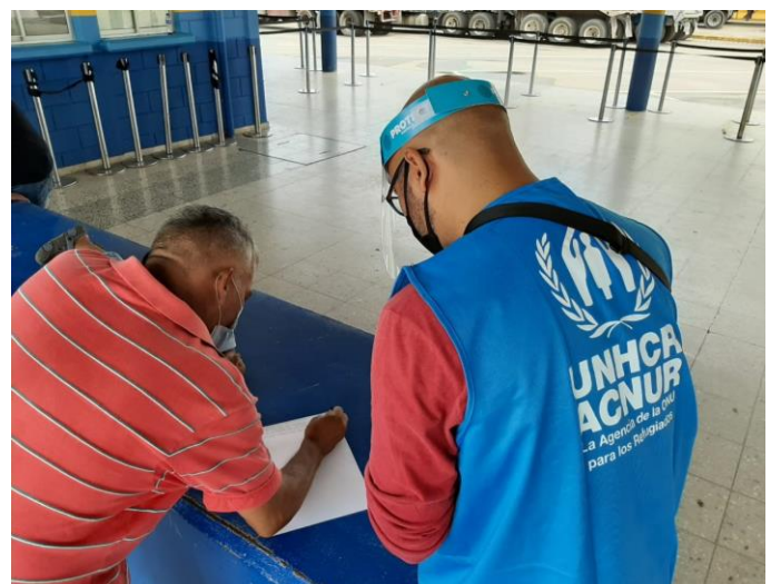
Brindando asistencia a un solicitante de la condición de refugiado en Guatemala en la frontera de El Corinto, Izabal.

Además, las expulsiones de personas guatemaltecas, hondureñas y salvadoreñas en su mayoría bajo el Título 42, desde los Estados Unidos a México y desde allá a Guatemala continúan. Basado en el monitoreo de las organizaciones socias de ACNUR y en las estadísticas de las instituciones estatales, ACNUR estima que desde el principio de agosto de 2021, más de 20,000 personas han sido expulsadas a Guatemala, entre ellas se identificaron al menos 376 personas con necesidades de protección.