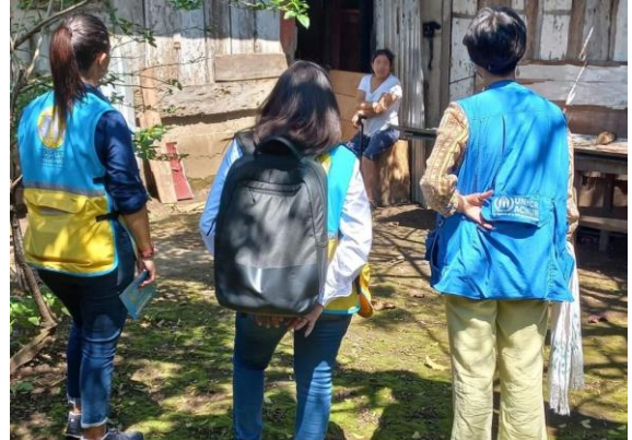
Visita domiciliaria a una solicitante de la condición de refugiado en Suchitepéquez.