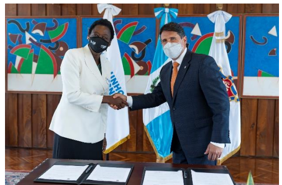
Firma de la Carta de Entendimiento con la Municipalidad de Guatemala.

ACNUR, la Agencia de la ONU para los Refugiados, está agradecida por el apoyo de: