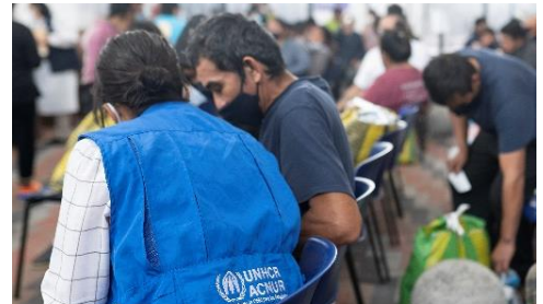
Brindando asistencia a personas en el Centro de Retornados en la Ciudad de Guatemala.