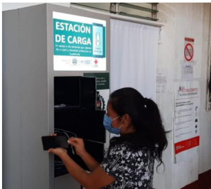
Nueva estación de carga en Tecún Umán.