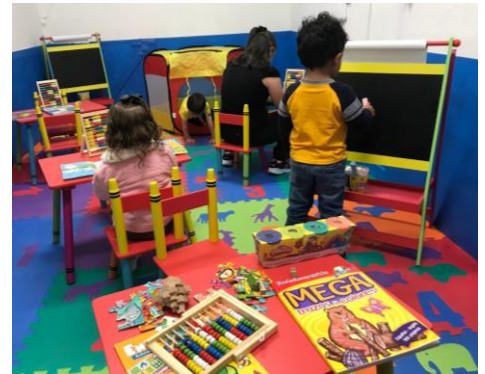
Espacio amigable para niñas y niños en la biblioteca pública de Quetzaltenango.